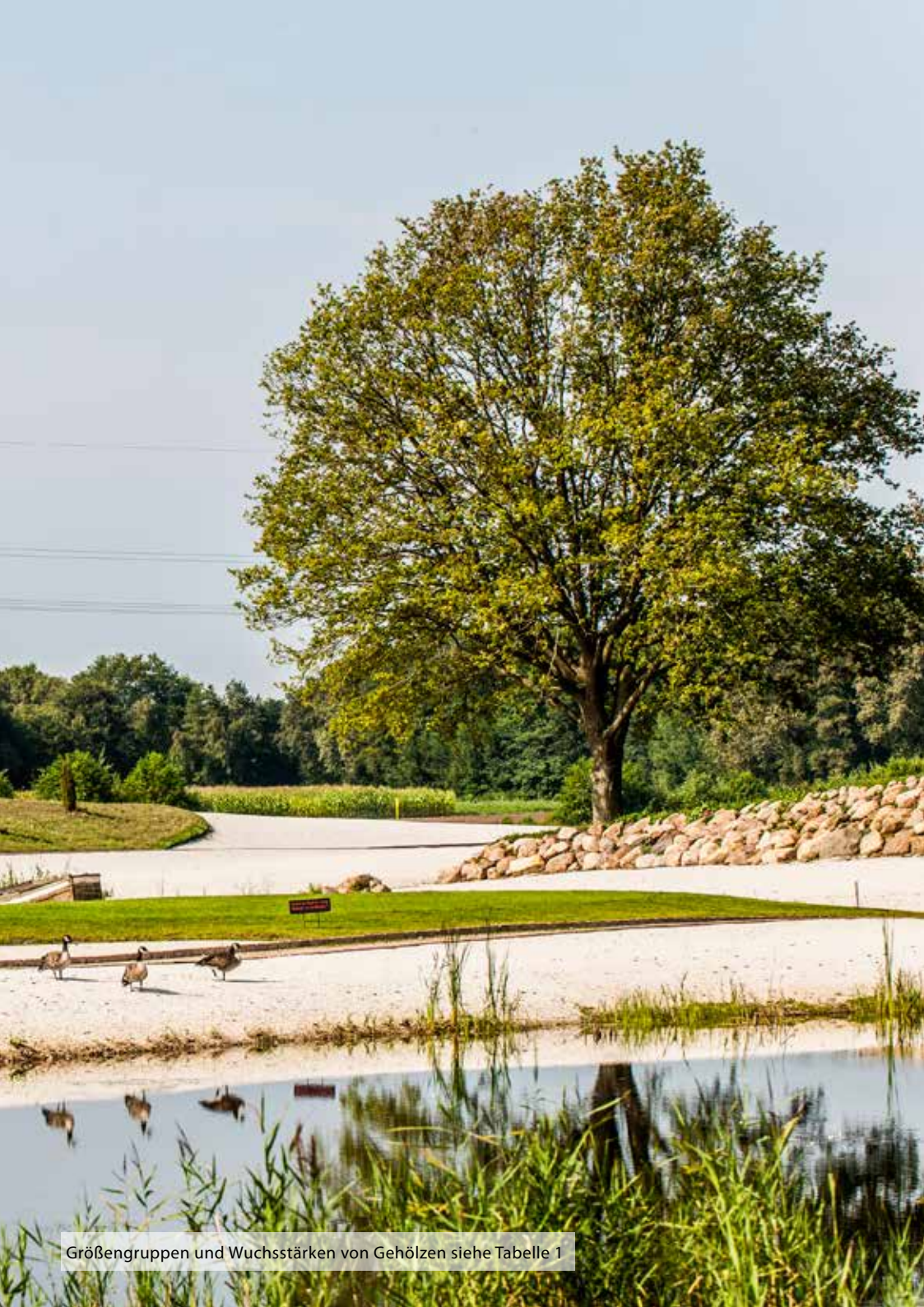
Größengruppen und Wuchsstärken von Gehölzen siehe Tabelle 1